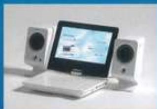
ワンセグチューナー内蔵DVD